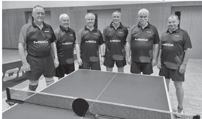
Mannschaftsfoto 3. Mannschaft

Der TTC Eppertshausen hat sich für die kommenden Spielzeiten entschieden, den gesamten Damen- und Herrenbereich mit neuen Trikots auszustatten. In diesem Zuge ist es dem Verein gelungen, mit Merck einen Kooperationspartner zu finden und das Projekt gemeinsam umzusetzen. Für die kommenden drei Spielzeiten werden die Mannschaften des TTC einheitlich in den neuen Trikots in die Verbands-spiele gehen und um Siege für den Verein kämpfen. Der gesamte Verein und Vorstand danken Merck für die Unterstützung.