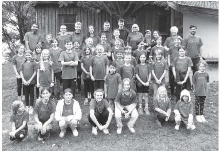
37 TAV-Kids verbrachten ein schönes, wenn auch nasses, Wochenende bei Spiel und Sport im Kreisjugendheim Ernsthofen. Der Vorstand bedankt sich bei den Betreuern und Betreuerinnen für die Organisation und Durchführung der Veranstaltung.

Tanzgruppe Just for Fun , ab 30 Jahren, dienstags von 21.00-22.00