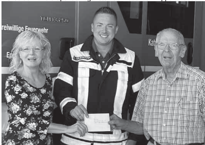
Spendenübergabe mit dem Kath. Kirchenchor St. Valentin.

Wir bedanken uns herzlich beim CDU-Gemeindeverband Eppertshausen für die Einladung zum Weinfest, dem Kath. Kirchenchor St. Valentin und der Handballspielgemeinschaft Eppertshausen – Münster – Urberach für die Spende zugunsten der Feuerwehr Eppertshausen.