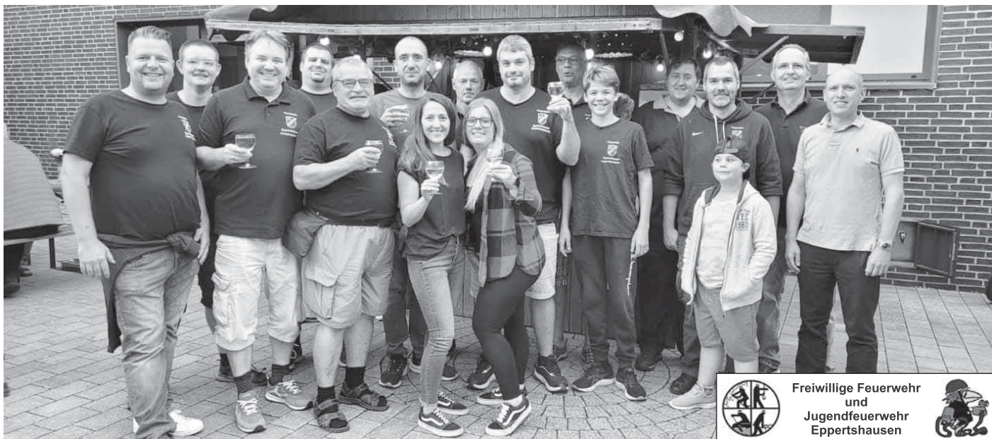
Besuch Weinfest an der Bürgerhalle.