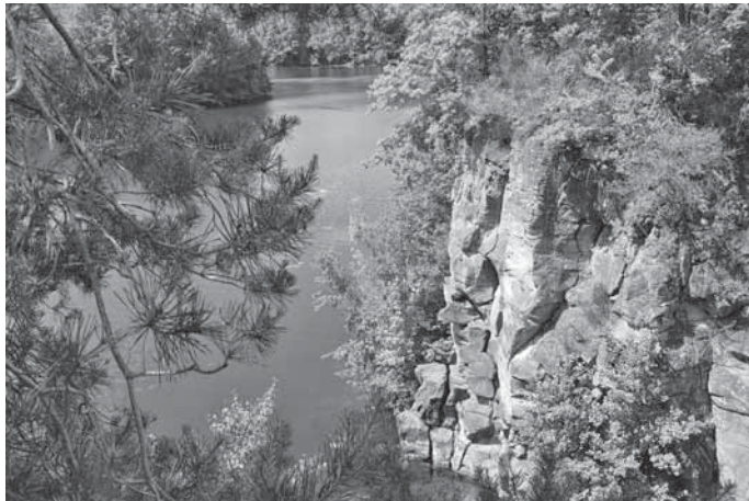
Mühlheimer Klippen

Anmeldungen nehmen die Familie Kraus (Tel. 06071 34681) und Schledt (Tel. 06071 36936) entgegen. Es besteht auch die Möglichkeit sich online auf unserer Homepage unter www.owk-eppertshausen.de für diese Fahrradtour anzumelden. Gäste sind jederzeit sehr herzlich eingeladen an unseren Unternehmungen teilzunehmen.