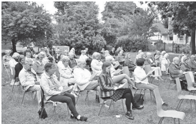
4 „Sei Hilfe, sei Kraft / die Frieden schafft“, singen die zahlreichen Gottesdienstbesucher aus EG 171 („Bewahre uns Gott“).