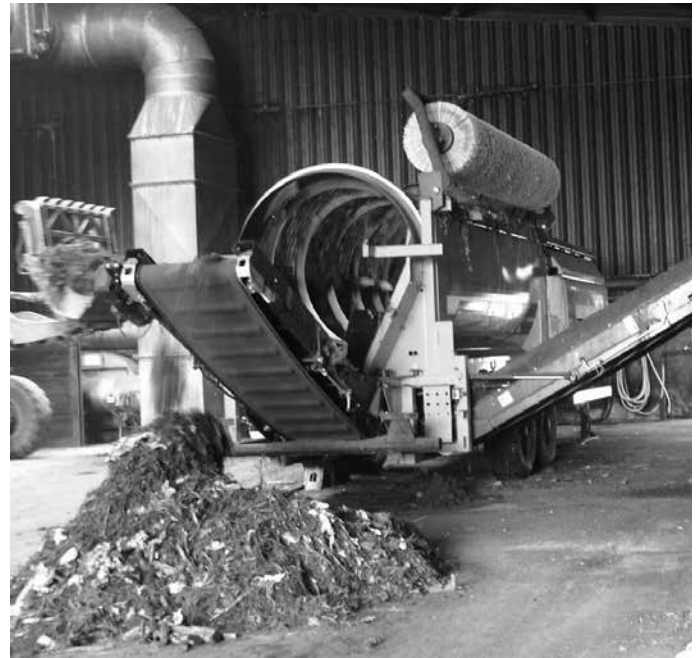
Bioabfall wird wie hier in Semd aufwändig von Störstoffen befreit.

Auch vermeintlich biologisch abbaubare Stoffe gehören nicht immer in die Biotonne. Auf der Seite des ZAW findet sich unter Abfall ABC - ZAW eine detaillierte Auflistung aller Abfallarten. Tierfäkalien beispielsweise haben in der Biotonne genauso wenig zu suchen wie rohes Fleisch und Knochen in größeren Mengen. Auch die Verwendung von sogenannten Bioplastikmülltüten schafft in den Kompostierungsanlagen große Probleme: Kompostierbares Plastik braucht für die Verrottung deutlich länger als Biomüll. Damit ist es industriell nicht kompostierbar und ein Störfaktor in den Kompostierungsanlagen. Sehr gut hingegen eignen sich die kompostierbaren Papiertüten, die der ZAW an seinen Kompostierungsanlagen verkauft.