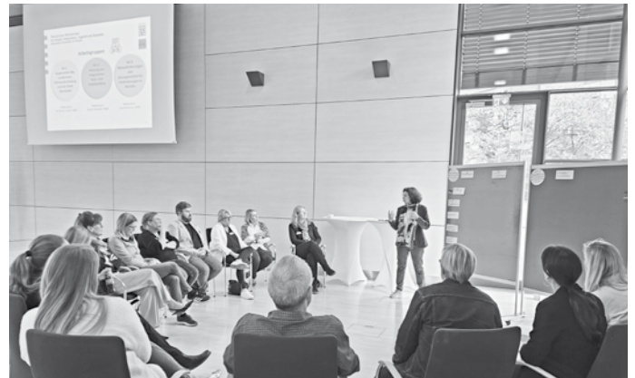
Regionale Akteure erarbeiteten gemeinsam neue Ansätze zur Fachkräftesicherung.

Die Ergebnisse der Zukunftswerkstatt werden nun vom IWAK abschließend zusammengefasst und allen beteiligten Akteuren zur Verfügung gestellt. Ziel ist es, die regionale Fachkräftesicherung langfristig zu verstetigen und neue Impulse für eine innovative und praxisnahe Arbeitsmarktpolitik zu setzen.