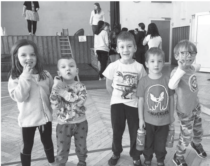
Am 26.03.2023 folgten einige Kinder des TAV 1890 der Einladung des Turngau Offenbach-Hanau zum Kindererlebnistag nach Heusenstamm. Unter dem Motto „Tag auf dem Bauernhof“ luden dort verschiedene Gerätelandschaften zum Balancieren, Klettern und Schaukeln ein. Alle TAV-Kinder hatten bei ihrem Besuch auf dem Bauernhof großen Spaß.

Turn-Athletik-Verein 1890 e.V. Eppertshausen