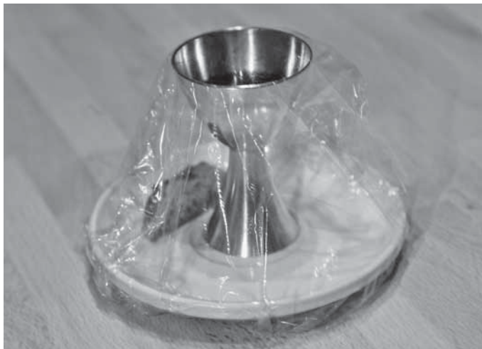
Teller samt Brot und Kelch sind zu Beginn mit Bio-Frischhaltefolie versiegelt.

Im Detail sieht der geänderte Ablauf so aus: Links am Eingang sind Teller mit Brot und Einzelkelchen vorbereitet. Auf den Tellern befindet sich jeweils ein Stück Brot und ein mit Saft oder Wein gefüllter, entsprechend gekennzeichnete Einzelkelch. Die Teller samt Brot und Kelch sind mit Frischhaltefolie versiegelt. Beim Hereinkommen nehmen sich Besucherinnen und Besucher, die am Abendmahl teilnehmen möchten, Teller und Einzelkelch mit an ihren Platz und stellen den Teller unter ihren Stuhl auf den Boden.