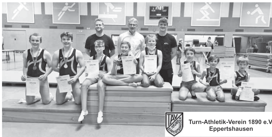
Turn-Athletik-Verein 1890 e.V. Eppertshausen

Am vergangenen Sonntag, 27.03.2022, richtete der TAV Eppertshausen die diesjährigen Gau-einzelmeisterschaften im Gerätturnen männlich des Turngaus Offenbach-Hanau aus. Unter Einhaltung der 3G-Regel und einem Hygienekonzept konnten mehr als 50 Turner einen der ersten Wettkämpfe während der Coronapandemie bestreiten.