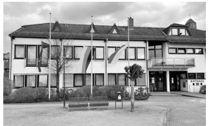
Flaggen auf halbmast