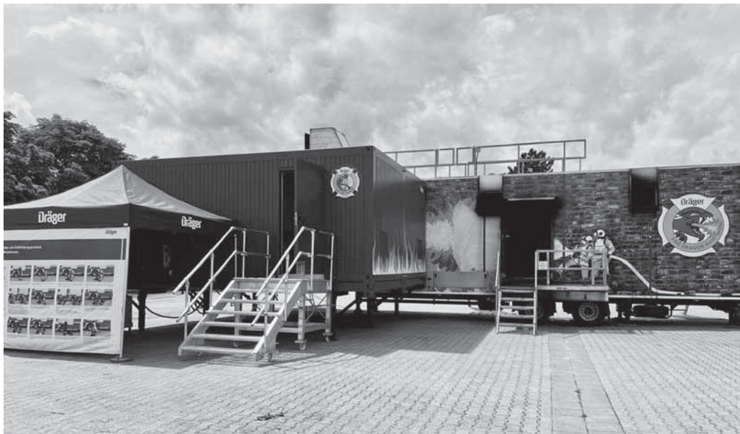
Feuerwehren üben Brandbekämpfung

Die Brandsimulationsanlage (Bild) der Firma Dräger Safety steht den Feuerwehren täglichen von 12 bis 22 Uhr und am Wochenende von 10 bis 20 Uhr für Übungen zur Verfügung. Neben dem Techniker, der von der Firma Dräger gestellt und die Anlage in der Technik betreut, wird das Personal überwiegend durch ehrenamtliche Kreisausbilder aus den Sparten „Atemschutz“ und „Truppführerausbildung“ sowie Mitarbeitende des Brandschutzamtes gestellt. Die Kreisausbilder und Helfer werden in zwei Schichten, jeweils mit bis zu zehn Personen, vor Ort sein und für einen reibungslosen Ablauf sorgen. Um