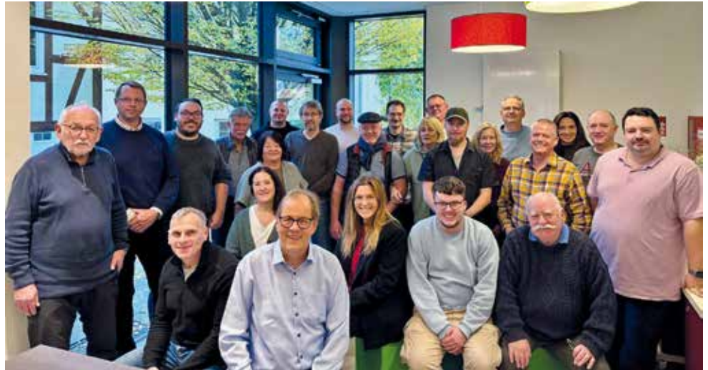
Teilnehmer der CDU-Klausurtagung 2025

Bis spät in den Abend wurde gearbeitet. Der „Siebener-Ausschuss“ erarbeitete den Vorschlag für die Kandidatenliste zur Kommunalwahl