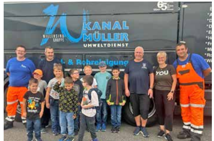
Ausflug der Löschwölfe Eppertshausen zu der Firma Kanal Müller Umweltdienst.