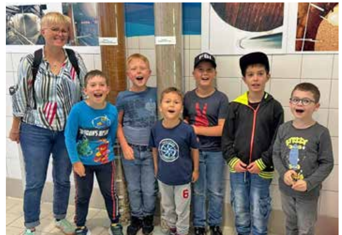
Die Löschwölfe beim Besuch des Wasserwerks Hergershausen

der Feuerwehrfamilie sein wollen: Die Kinderfeuerwehr trifft sich jeden 2. Montag von 16:45 Uhr bis 17:45 Uhr am Feuerwehrhaus Eppertshausen. Mitmachen können alle Schulkinder zwischen 6 und 9 Jahren.