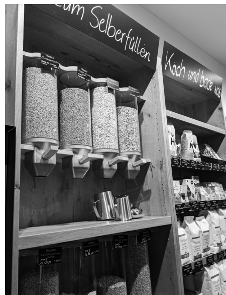
Auch neue Trends wie die verpackungsfreie Abgabe von Lebensmitteln an Kunden werden im Seminar besprochen.

Informationen erhalten Sie bei Sabine Biberger, AELF Ingolstadt, Tel. 0841/3109-321 oder sabine.biberger@aelf-in.bayern.de