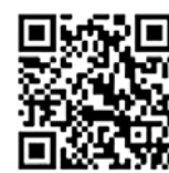
QR-Code zu den LKK-Vorsorgeleistungen der Zahn- und Mundgesundheit