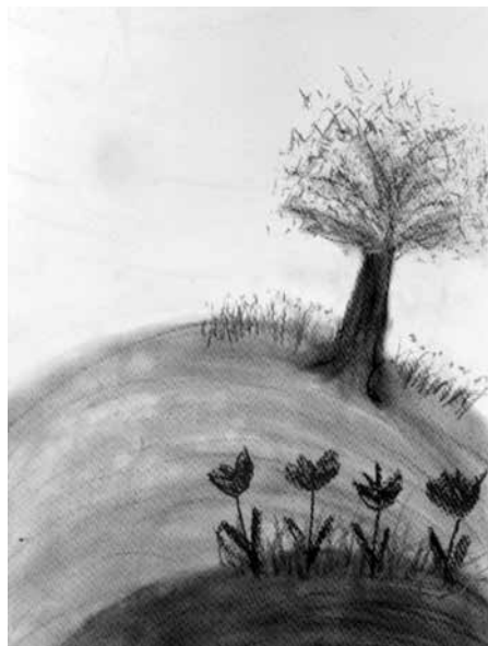
„Ich mal mir die Welt, wie sie mir gefällt“, © Christiane Leuner

„Ich mal mir die Welt, wie sie mir gefällt“ ist ein Angebot für Kinder von fünf bis acht