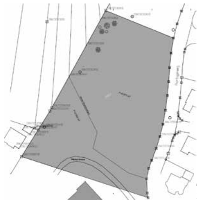
Lageplan mit neuer Grenzföhrung vom 08.04.2020

Der Gemeinderat der Gemeinde Leidersbach hat in öffentlicher Sitzung vom 21.04.2020 gemäß § 2 Abs. 1 BauGB die Aufstellung des Bebauungsplanes „Seniorenzentrum Leidersbach“ beschlossen.