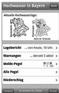
Bild 1: Das Online-Angebot m.hnd.bayern.de/ bietet alle Hochwasserwarnungen auf einen Blick.

über Lageberichte, Warnungen, Wasserstände und Niederschläge. Das Online-Angebot erreichen Sie unter www.hnd.bayern.de . Den bayernweiten Lagebericht können Sie auch über eine automatische Telefonansage (Tel. 0821/ 9071-59 76) abrufen. Ebenso informieren Meldungen im Teletext des Bayerischen Fernsehens (Seite 647) sowie im lokalen Rundfunk kurzfristig über Gefahren. Im Hochwasserfall geben die Lageberichte mehrmals täglich einen Überblick zur Hochwassersituation und eine Vorschau auf die weitere Entwicklung. In den Warnungen beschreiben die Wasserwirtschaftsämter detailliert nach Landkreisen die Hochwasser-Situation. Jeder kann darüber hinaus unter www.hnd.bayern.de die Wasserstände an den Pegel-Messstationen in seiner Nähe verfolgen. Hinweis: Für Überschwemmungen, wie sie zum Beispiel durch örtlich begrenzte Starkregen (Gewitter) auftreten, können keine Warnungen und Vorhersagen erstellt werden. Weitere Informationen sowie viele Tipps zur Hochwasservorsorge finden Sie unter www.hochwasserinfo.bayern.de , dem Informationsportal der bayerischen Wasserwirtschaftsverwaltung rund um das Thema Hochwasser.