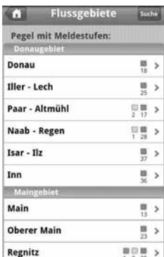
Bild 2: Auf m.hnd.bayern.de/ können Sie sich ganz einfach über die aktuellen Wasserstände in Flüssen informieren.

Weitere Tipps zur Vorsorge sowie ausführliche Informationen zum Thema Hochwasserschutz in Bayern finden Sie unter www.hochwasserinfo.bayern.de