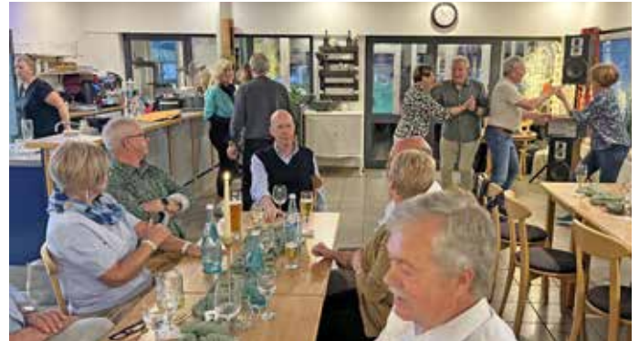
Text und Bild privat: J. Riehl

War es doch wieder eine gelungene Feier am 24. April in der FVE-Ver-einsgaststätte „Bei Ben“ mit vorzüglichem Essen, ausgelassener Stimmung und toller Atmosphäre. Was den unterhaltsamen Teil des Abends betraf, sorgte unser Altmeister DJ Klaus mit seiner gekonnten Musikauswahl dafür, dass rege das Tanzbein geschwungen wurde.