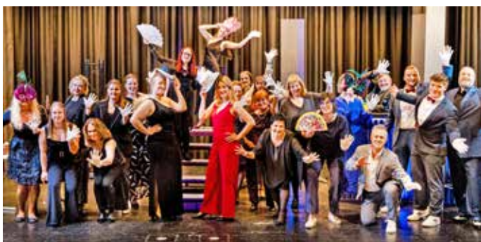
Wir entfachen Magie“ – das Eröffnungstück des Musical Cocktails aus dem Broadway-Musical „Pippin

Die Inszenierung überzeugt mit einer spritzigen Mischung aus energiegeladenen Tanznummern, stilvollen Kostümen, einem prächtigen Bühnenbild und stimmungsvoller Showtechnik. Die rund 100 Mitwirkenden