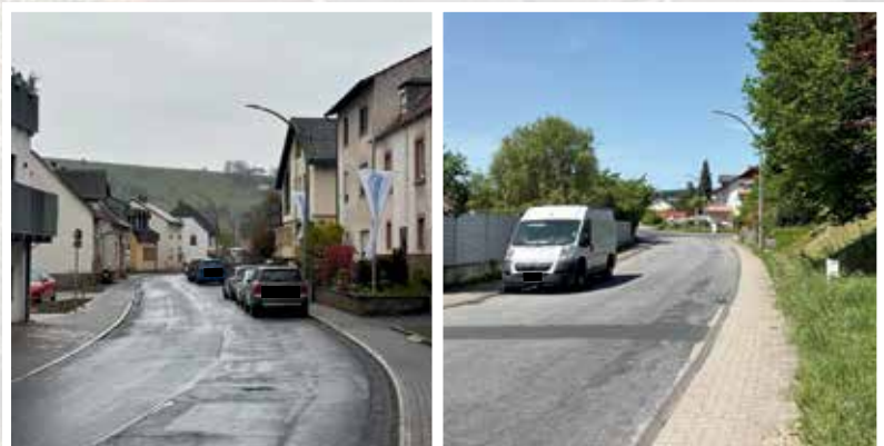
Beispielbilder aus Leidersbach und Roßbach