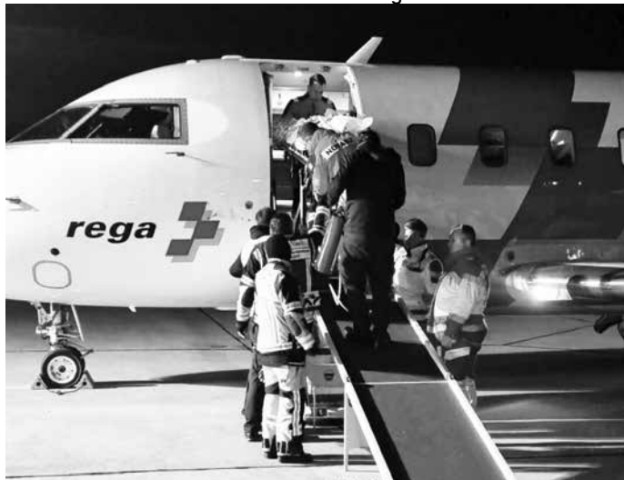
Übernahme der zwei künstlich beatmeten Patienten aus dem Ambulanzflieger der Schweizer Rega

Mit einer Mitgliedschaft im DRK-Kreisverband Dieburg e. V. sind Fördermitglieder nicht nur Teil einer starken Gemeinschaft, sondern auch abgesichert: Im Falle von Unfällen oder Erkrankungen – auch im Ausland – greift die Rückholversicherung des DRK. So kann im Ernstfall eine schnelle und qualifizierte Hilfe organisiert werden, wie auch bei diesem Einsatz eindrucksvoll unter Beweis gestellt wurde.