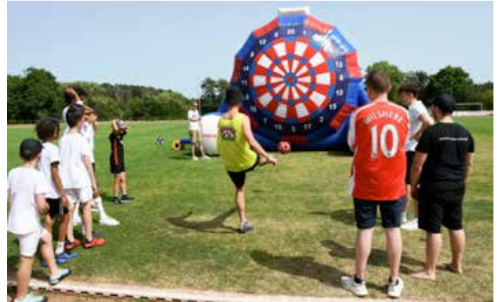
Beim Turnier im Fußball-Darts machten am Samstagnachmittag im Eppertshäuser Sportzentrum zwölf Teams mit.

Der Zielwettbewerb auf die aufblasbare Scheibe (die 300 Euro Mietkosten hatte die Eppertshäuser Firma AC-Motoren gesponsert, die selbst mit einem Team teilnahm) fand auf dem Naturrasen-Großfeld statt, wo auch ein Fußballtennis-Feld aufgebaut war. Zwischen Naturrasen- und Kunstrasen-Großfeld will der FVE demnächst das Sprecherhäuschen sanieren und einen neuen, zu beiden Seiten geöffneten Kiosk errichten. Bei den Heimspielen der ersten Mannschaft gibt es in der neuen Saison auch neue Spieler zu sehen: Der A-Ligist, diesmal Vizemeister hinter dem TSV Altheim und auch 2022/23 wieder ein