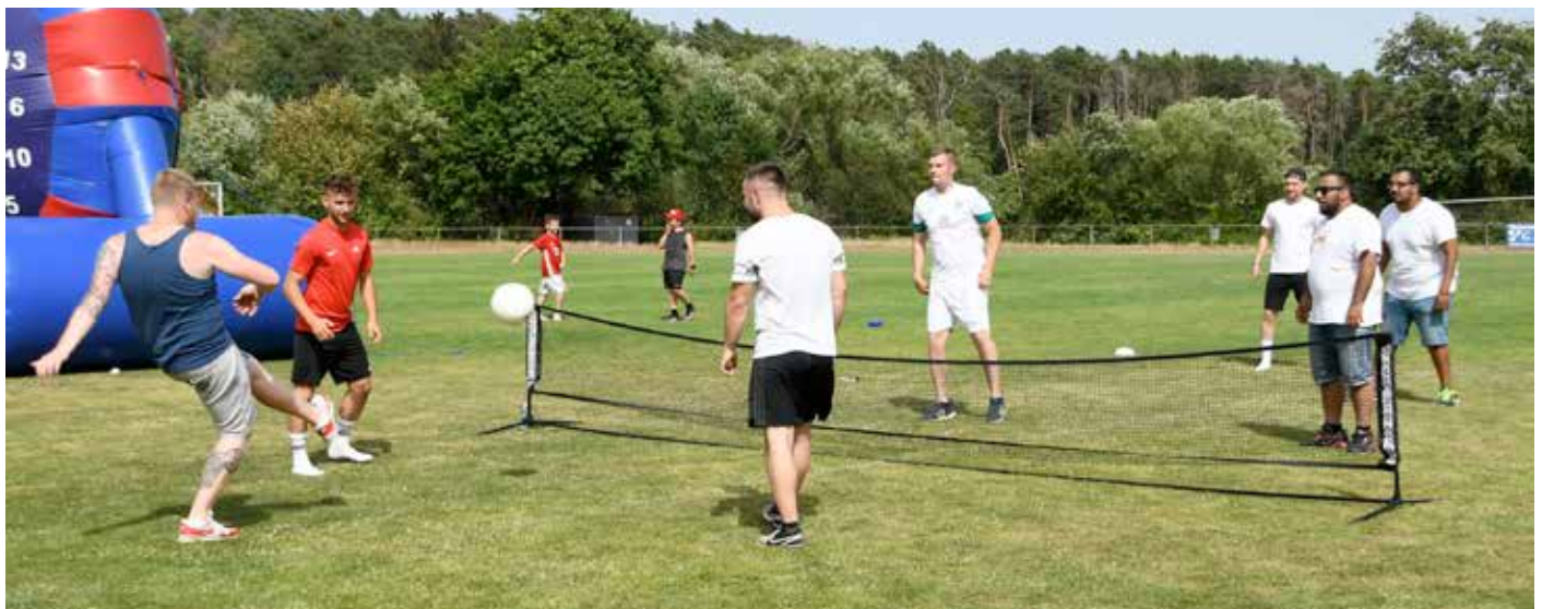
Auf dem Naturrasen-Großfeld des Eppertshäuser Sportzentrums konnte man am Samstag nicht nur Fußball-Darts, sondern auch Fußball-Tennis spielen.