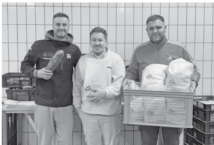
Mit ofenfrischen Grüßen Ihr Team von MeinFrühstück24 Darmstadt-Dieburg

Großraum Darmstadt-Dieburg/Seligenstadt – Der Frühstückslieferservice „MeinFrühstück24“ feiert sein zweijähriges Bestehen. Seit der Gründung beliefert das Unternehmen Haushalte im Großraum Darmstadt-Dieburg bis nach Seligenstadt an Wochenenden und Feiertagen mit frischen Backwaren einer regionalen Handwerksbäckerei – kontaktlos und in den frühen Morgenstunden direkt vor die Haustür. Neben klassischen Backwaren umfasst das Angebot auch weitere Frühstücksprüfprodukte aus der Region, darunter Aufstriche, Säfte oder Kaffee. Die Preise entsprechen dabei den regulären Filialpreisen der Bäckerei, hinzu kommt lediglich eine Liefergebühr von 1,59 Euro. Der Service richtet sich insbesondere an Menschen, die in ihrer Mobilität eingeschränkt sind oder keine Bäckerei in unmittelbarer Nähe haben. Aber auch viele Familien und Berufstätige nutzen das Angebot, um sich am Wochenende den Weg zur Bäckerei zu sparen. Mittlerweile zählt „MeinFrühstück24“ über 2.000 registrierte Nutzerinnen und Nutzer. Bestellungen können flexibel nach Bedarf oder als regelmäßige Dauerbestellung aufgegeben werden. Zum Kennenlernen bietet das Unternehmen neuen Kundinnen und Kunden einmalig eine kostenlose Probestüte mit vier ausgewählten Brötchen an. Weitere Informationen und Registrierung unter: www.meinfruehstueck24.de