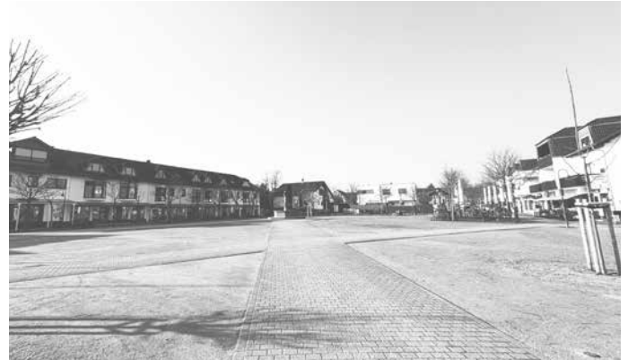
Der Franz-Gruber-Platz muss grüner und lebendiger werden.

Gemeinsam mehr erreichen. Für Eppertshausen. Für Dich.