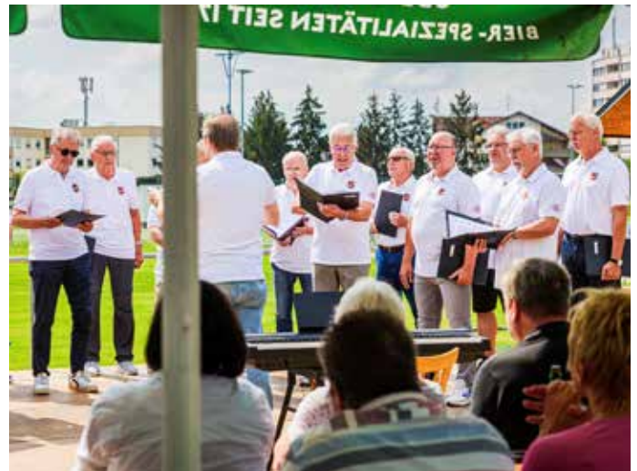
Der Chor der Germania bei seinem Auftritt in Münster.

Gesangverein Germania 1890 e.V. Eppertshausen