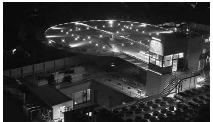
Der Hubschrauberlandeplatz aus zwei Perspektiven