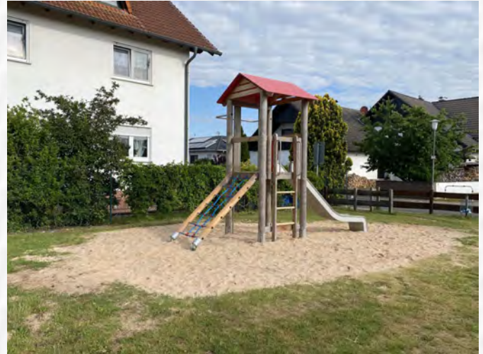
Das neue Spielgerät ist jetzt zum Spielen freigegeben!