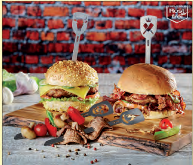
Bei der Zubereitung des perfekten Burgers hilft Zubehör aus Edelstahl Rostfrei.