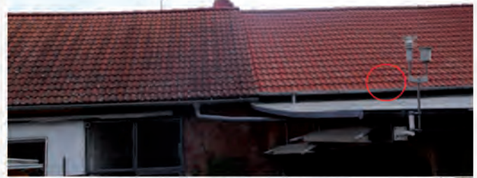
Referenzobjekt: 26 Jahre alte Dachfläche. Rechte Seite im April 2016 behandelt. Foto vom Juli 2017. Die herausgenommenen Ziegel sind fast nicht mehr zu erkennen. Das Objekt kann besichtigt werden.

Photovoltaik- und Solaranlagen sind ebenfalls von Verschmutzungen durch Witterungseinflüsse betroffen. Schon geringe Ver-