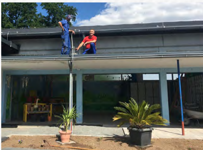
Für den Blitzschutz ist gesorgt! Die Schaafheimer Firma Pavlovic installierte eine Blitzschutzanlage

Was hingegen klar ist: Die Umbauarbeiten im Eingangs- und Kioskbereich gehen planmäßig in den Endspurt: Der Gemeindevorstand hat sich in einer außerplanmäßigen Sitzung über den Fortgang der Arbeiten informiert.