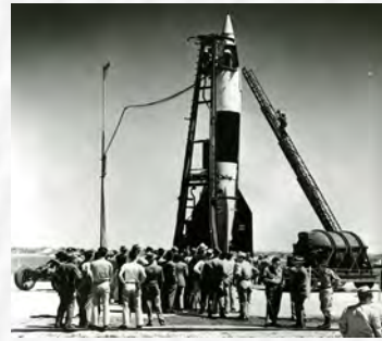
Raketentest in Amerika: Ein V2-Nachbau