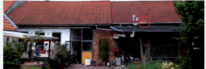
Referenzobjekt: 25 Jahre alte Dachfläche, vor der Behandlung der rechten Dachfläche April 2016.