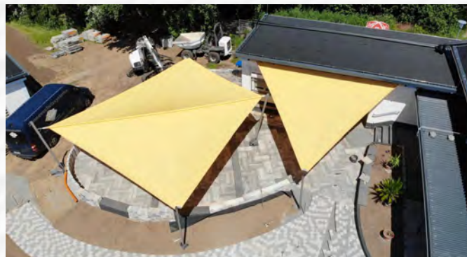
Der Eingangs- und Kioskbereich mit Sonnensegeln – hier aus der Vogelperspektive – wurde ganz neu gestaltet

„Doch Gesundheit und Sicherheit gehen vor und das Verbot von Großveranstaltungen wurde vorerst bis 31.08.2020 von der Hessischen Landesregierung ausgesprochen. Daher müssen auch alle geplanten Feierlichkeiten rund um das 50-jährige Jubiläum für dieses Jahr abgesagt werden. Immerhin werden kleine und große Badefreunde das Freibad – wenn auch eingeschränkt – genießen können.“