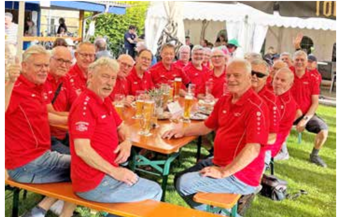
Text und Bild: Josef Riehl

„Die rote Bande kommt“, mit diesen Worten wurde die Herrengymnastik-Gruppe des FV Eppertshausen „Der bewegte Mann“ mit ihren leuchtend roten Trikots im Germania Biergarten Ober-Roden empfangen. Die erste Radtour des Jahres führt uns schon traditionell dorthin. Bei gutem Wetter und bester Stimmung verbrachten wir ein paar kurzweilige Stunden bevor es wieder nach Hause ging. Die Gruppe besteht aus ca. 30 Männern im Alter von Mitte 50 bis über 80 Jahre. Treffpunkt ist jeden Dienstag um 18:00 Uhr in der Bürgerhalle Eppertshausen. Ohne Leistungsdruck stehen leichte Ballspiele, Rücken- und Wirbelsäulengymnastik, Koordinationstraining, Stärkung der gesamten Muskulatur und Dehnungsübungen an. Interessierte sind herzlich willkommen.