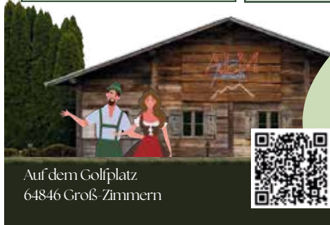
Auf dem Golfplatz 64846 Groß-Zimmern