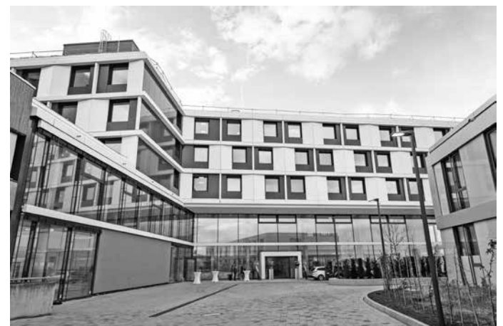
Das neue Bettenhaus in Groß-Umstadt geht im Juni in Betrieb.

Aufgrund der großen Nachfrage hat sich die Kreisklinik Darmstadt-Dieburg dazu entschieden am Samstag, 20. April, weitere geführte Rundgänge durch das neue Bettenhaus anzubieten. Die kostenlosen Tickets können ab Montag, 15. April, im Internet unter www.kreiskliniken-darmstadt-dieburg.de gebucht werden.