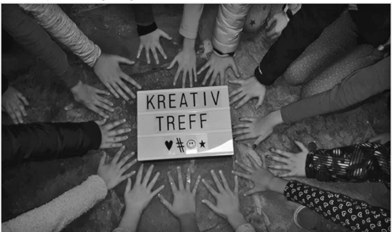
*Upcycling verbindet das englische up (nach oben) und recycling (Wiederverwertung) zu einem neuen Wort. Sperrmüll, scheinbar nutzlose Verpackungen, Müll allgemein, werden zu neuen Kunstwerken und Gebrauchsgegenständen umgewandelt.