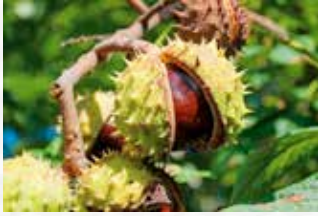
Im Oktober werden die ersten Kastanien reif

Beete, Rotkohl, Schwarzwurzel, Sellerieknolle, Spinat, Spitzkohl, Stangenbohnen, Staudensellerie, Steckrübe, Tomaten, Weißkohl, Wirsing, Zuckermais, Zucchini, Zwiebeln