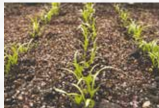
Spinat wächst auch noch im Oktober wunderbar im Beet

Im Ziergarten werden Kaltkeimer wie Phlox ( Phlox paniculata ), Fackellilie ( Kniphofia ) und Bergenie ( Bergenia ) ausgesät. Auch der Eisenhut ( Aconitum ) kann im Oktober eine Stelle im Beet erhalten. Doch Vorsicht: Er ist hochgiftig und sollte nicht in der Reichweite von Kindern stehen. Zudem eignet sich der Oktober wunderbar, um eine winterharte Gründüngung wie Senf ( Sinapis ) auszubringen. Auch einjährige, winterharte Pflanzen wie Kornblume ( Centaurea cyanus ) und Klatschmohn ( Papaver rhoeas ) können Sie im Oktober aussäen.