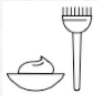
Schützt vor dem Verblässen der Farbe

Entwickelt, um coloriertes Haar zu reparieren und aufzubauen, für lang anhaltende Farbbrillanz.