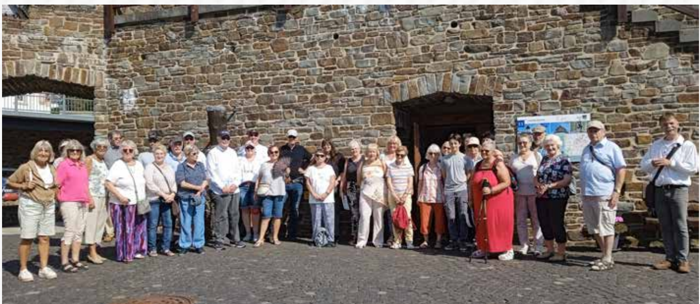
Mitglieder der ev. Kirchengemeinden Kleestadt, Langstadt, Richen und Schlierbach unternahmen am ersten Septembersonntag einen gemeinsamen Busausflug in den Hunsrück. In Simmern gruppierte man sich beim Stadtrundgang zu einem Erinnerungsfoto am "Schinderhannesturm".