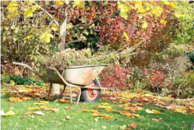
Im Gartenmonat Oktober gibt es noch viel zu tun

Was blüht im Oktober? Was kann man im Oktober noch pflanzen und säen? Welches Gemüse hat im Oktober Saison? Unsere Tipps zur Gartenarbeit im Oktober im Überblick.