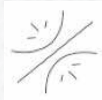
Schutz der Haarfaser