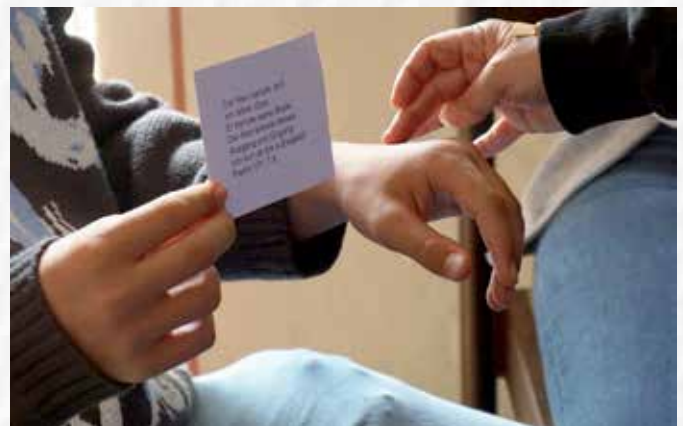
An einer Erfahrungsstation wurde den Jugendlichen ein Kreuz mit Salböl auf den Handrücken gezeichnet und ein Segenswort zugesprochen.