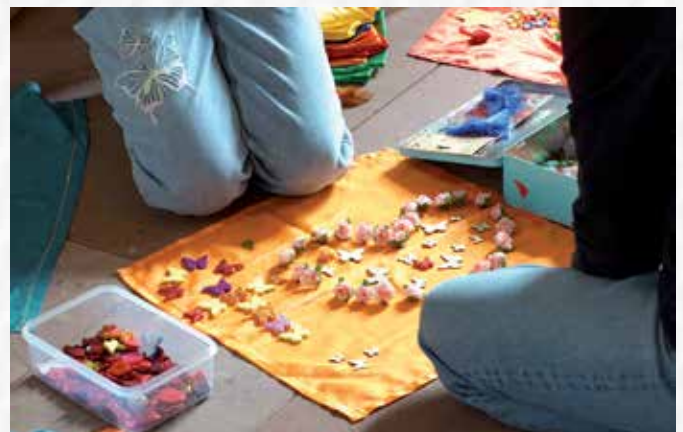
Jugendliche denken über das Gute und Schöne in ihrem Leben nach und legen dazu ein Bodenbild.