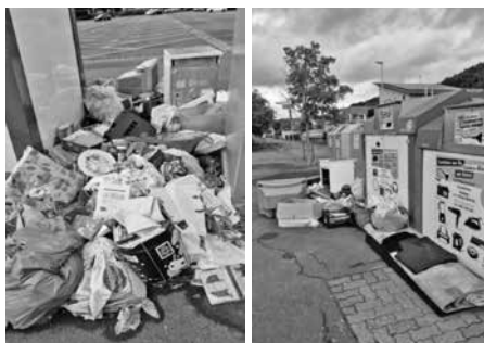
So sieht es zuweilen an manchen Containerstandorten aus, wenn Unbekannte Müll illegal entsorgen.

Mit dem neuen Wegweiser ergänzt der Landkreis sein bestehendes Online-Informationsangebot. Die Broschüre ist ab sofort kostenfrei beim Landratsamt Miltenberg, in den Rathäusern sowie insbesondere bei der Beratungsstelle für Senioren und pflegende Angehörige erhältlich.