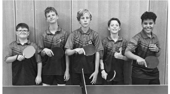
Die TTC-Meistermannschaft der Jungen 13