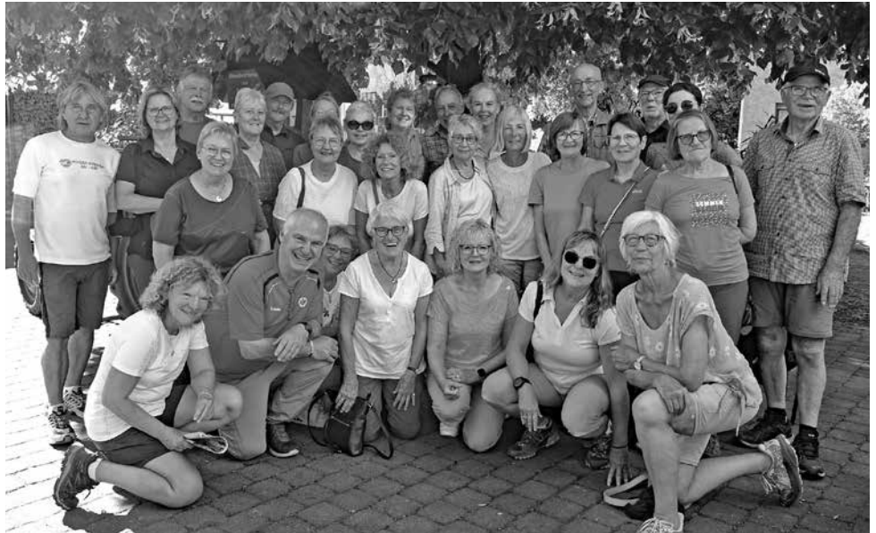
Geschafft: Die Wanderer des OWK Eppertshausen am Ziel ihrer 4-tägigen Moseltour.

Zum Abschluss der Wanderung geht es für beide Gruppen in die Anglerstubb am Oberwiesensee.