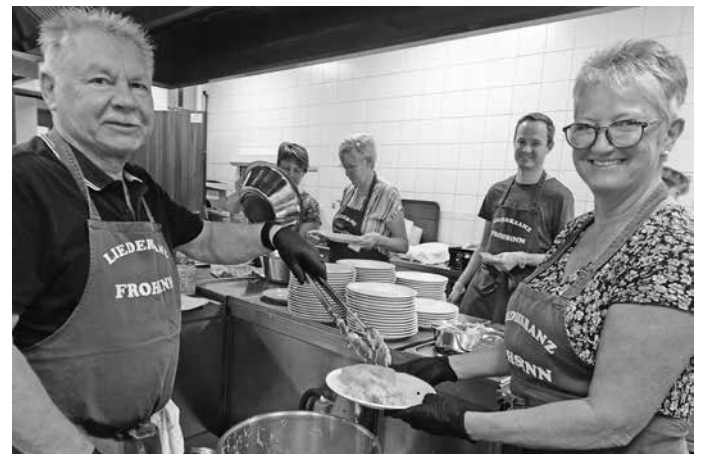
Sah lecker aus und schmeckte auch so: Das Küchenteam bei der Arbeit mit Rippchen und Kraut.