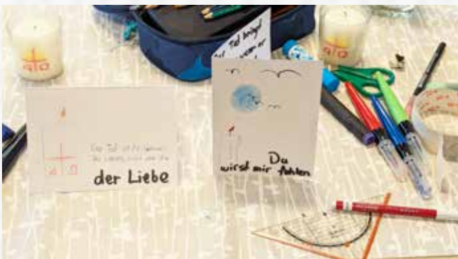
Konfirmandinnen und Konfirmanden wurden beim Konfi-Tag kreativ und gestalteten Trauerkarten, die Trost und Hoffnung ausdrücken.