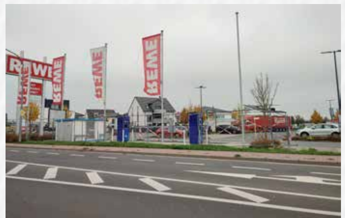
Unser Foto zeigt die Schnellladesäulen am Rewe-Markt in Schaafheim.

Schaafheim. (CR) In der vergangenen Woche wurden zwei Schnellladesäulen mit einer Leistung von bis zu 150 kW am Rewe-Markt in Schaafheim errichtet. Die Firma Aral von einer Inbetriebnahme im Dezember aus. Die Ladesäulen besitzen jeweils zwei Ladepunkte. Die Baumaßnahme in Schaafheim ist Teil des deutschlandweiten Ausbaus von Aral pulse, der EMobilitätsmarke von Aral. Inzwischen betreibt die Firma mehr als 3.000 Ladepunkte an mehr als 400 Standorten und plant weiteren Ausbau. Erst kürzlich wurde Aral pulse zum zweiten Mal in Folge im Connect Ladenetztest als bester Schnellladeanbieter Deutschlands ausgezeichnet, als einziger Anbieter mit der Note „Sehr gut“.