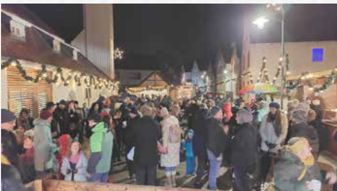
„Volles Haus“ wird wieder am alten Feuerwehrhaus in der Hofgasse sein. Die Buben und Mädchen der Lindenfelschule und des Kindergartens üben schon eifrig und freuen sich auf ihre Auftritte.