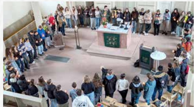
Als Zeichen der Hoffnung empfangen die über 70 Konfirmandinnen und Konfirmanden sowie Mitarbeitende in der Schaafeimer Kirche ein Licht verbunden mit einem Bibelwort.