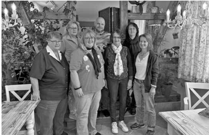
Der Vorstand erlangte bei der Klausurtagung viele neue Erkenntnisse und nutzte das gemeinsame Wochenende für die Festlegung der kommenden Aufgaben.