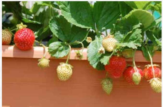
Im Mai können die leckeren Erdbeeren geerntet werden

Aus dem Gewächshaus oder Folientunnel: Chinakohl ( Brassica rapa subsp. pekinensis ), Kohlrabi, Mangold, Rucola ( Eruca sativa ), Salate, Fenchel ( Foeniculum vulgare )