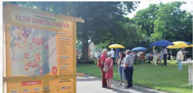
Zahlreiche Besucher genossen das bunte Programm und schöne Ambiente rund um die evang. Kirche Schaafheim im Juni 2024.

Wir bedanken uns schon jetzt für die freundliche Unterstützung durch die Gemeinde Schaafheim, den Gewerbeverein Schaafheim e.V., die VR Bank Dreieich-Offenbach und den „Kultursommer Südhessen“, gefördert vom Hessischen Ministerium für Wissenschaft und Forschung, Kunst und Kultur, unterstützt von der Sparkassen-Kulturstiftung Hessen-Thüringen.