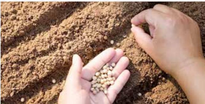
Erbsen, Bohnen, Rote Beete oder Karotten sind nur einige der vielen Gemüsearten, die im Mai direkt ins Freiland gesät werden

Sobald kein Frost mehr im Garten zu erwarten ist, können auf der Fensterbank vorgezogene Pflanzen ins Freiland umziehen und Gemüse auch direkt ins Beet gesät werden.