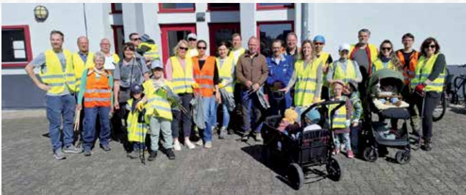
Viele Freiwillige vor Beginn der Müllsammelaktion bei bestem Wetter.

Schaafheim (eB) Am 25. April 2026 um 10 Uhr war es wieder so weit: Rund 35 Menschen trafen sich bei bestem Wetter an der Kulturhalle, um gemeinsam Müll zu sammeln. Was sofort spürbar war: Es ging nicht nur ums Aufräumen, sondern auch ums Zusammenkommen, Austauschen und Anpacken.