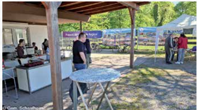
Essensausgabe und Plakate über die Vereinshistorie im Hintergrund