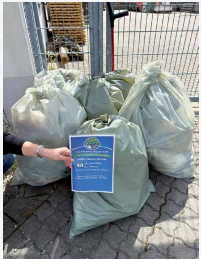
Das Ergebnis von zwei Stunden Müllsammeln