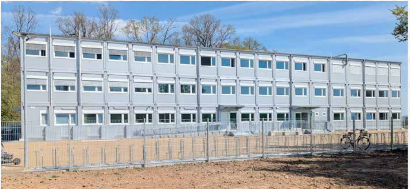
Die Interimsschule am Schwimmbad Schaafheim dient während der Sanierung der Eichwaldschule als moderner Ersatzstandort. Bauherr ist der Kreis Darmstadt-Dieburg.

räume, Lagerräume, Lehrerzimmer, Toiletten, eine Küche, Mensa, Treppenhäuser und Technikräume zur Verfügung. Insgesamt bietet die Anlage Platz für 200 bis 240 Schülerinnen und Schüler. Das Gelände ist eingezäunt und wurde speziell für die schulische Nutzung vorbereitet, sodass Sicherheit und Funktionalität gewährleistet sind. Bauherr der Maßnahme ist der Kreis Darmstadt-Dieburg, der mit der temporären Lösung eine verlässliche Übergangslösung geschaffen hat. Ziel ist es, den Unterrichtsbetrieb während der Sanierungsarbeiten an der Eichwaldschule ohne größere Einschränkungen fortzuführen und gleichzeitig moderne Lernbedingungen sicherzustellen. Nach Abschluss der Renovierung soll der Schulbetrieb wieder vollständig an den angestammten Standort zurückkehren. Der Start des Rohbaus für den Erweiterungsbau ist für September 2026 vorgesehen. Aus heutiger Sicht kann der geplante Bauablauf vollständig eingehalten werden. Im Wirtschaftsplan des Da-Di-Werks sind aktuell 44.950.000 Euro für die Erweiterung und 4.760.000 Euro für die Außenanlage eingeplant.