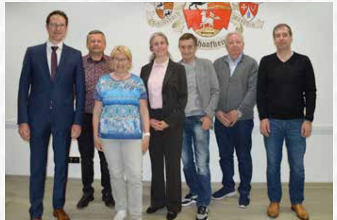
Die neu gewählte Gemeindevertretung der Gemeinde Schaafheim.