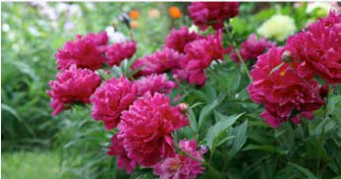
Im Mai zeigen Pfingstrosen ihre üppige Blütenpracht

Kurz bevor der Sommer richtig losgeht, gilt es, den Garten auf die große Hitze vorzubereiten. Wir zeigen in unserer Übersicht, welche Gartenarbeiten im Mai anstehen und was jetzt gepflanzt oder geerntet werden kann.