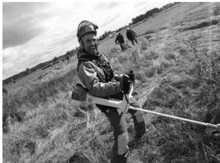
Der Lehrgang zum Geprüften Natur- und Landschaftspfleger/zur Geprüften Natur- und Landschaftspflegerin startet im September 2024.

zes und der Landschaftspflege, Umweltbildung und Öffentlichkeitsarbeit, aber auch Grundsätze des Gewerbe- und Steuerrechts oder des Arbeits- und Sozialrechts. Schwerpunkte bilden zudem der Einsatz von Maschinen und Geräten in der Landschaftspflege, die fachgerechte Pflanzung und Pflege von Hecken und Gehölzen, natur-schutzfachliche Grundlagen sowie Umwelt-pädagogik.