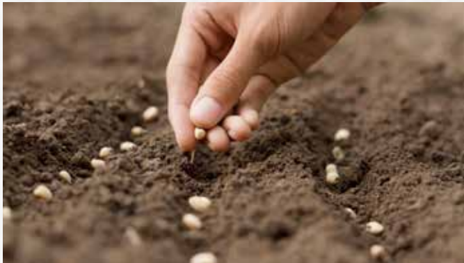
Im April können viele Pflanzen bereits direkt ins Freiland gesät werden.

Im April können Sie schon eine Vielzahl an Gemüsepflanzen aussäen. Während wärmeliebende Pflanzen wie Buschbohnen ( Phaseolus vulgaris ), Melone ( Cucumis melo ) oder Zucchini ( Cucurbita pepo subsp. pepo ) lieber noch im geschützten Haus bleiben oder im wärmenden Frühbeet ausgesät werden, können robustere Gemüsesorten wie Erbsen ( Pisum sativum ), Möhren ( Daucus carota subsp. sativus ) oder Spinat ( Spinacia oleracea ) direkt ins Beet gepflanzt werden.