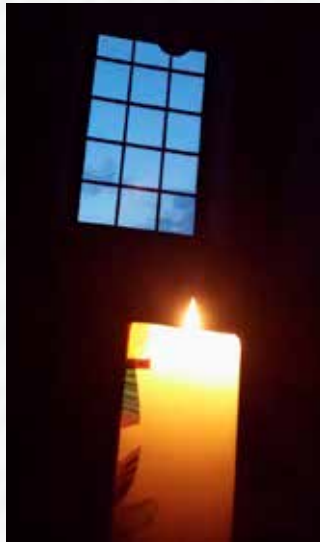
Osterkerze in der Evang. Kirche Schaafheim.

Unser guter Herr Jesus Christus, der Sieger über den Tod und alles Dunkel, tröste und trage Sie in dieser Zeit! Er macht am Ende alles gut – auf ihn dürfen wir vertrauen! Gesegnete Ostern!