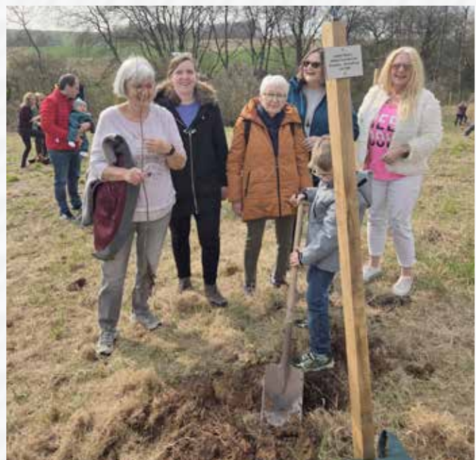
Pflanzloch ausheben war schon schwer, so der junge Helfer.