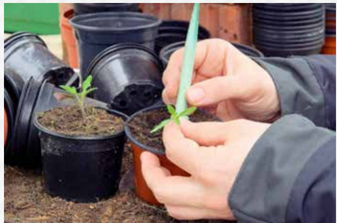
Tomatenpflänzchen sollten im April pikiert werden.

Tomaten pikieren: Wer Tomaten auf der Fensterbank vorzieht, sollte die Tomaten pikieren, sobald sie die ersten richtigen Blätter entwickelt haben. Mit einem Pikierstab oder eine Stricknadel können die Pflanzen vorsichtig aus der Erde gehoben und anschließend in eigene Töpfe gesetzt werden.