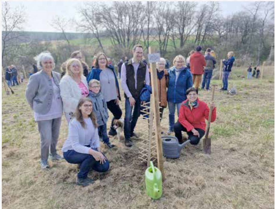
Der Baum der Freundschaft, die Esskastanie, kann jetzt wachsen.

Zur Erinnerung an die im Mai 1989 geschlossene Städtepartnerschaft zwischen Schaafheim und Richelieu war in einer Komiteesitzung im vergangenen Jahr der Beschluss zur Pflanzung eines Baums gefasst worden und die Wahl auf eine Esskastanie gefallen. Ein Schild am Pfosten verweist auf den Grund für das Pflanzen dieser Esskastanie: starker Baum – starke Freundschaft/Richelieu – Schaafheim seit 1989.