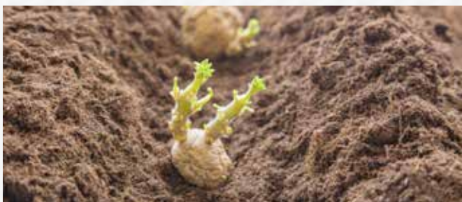
Im April können die ersten Kartoffeln gepflanzt werden.

Was pflanzt man im April? Blumenkohl, Fenchel, Kartoffeln, Kohlrabi, Mangold, Salate, Schnittlauch, Spitzkohl, Steckzwiebeln