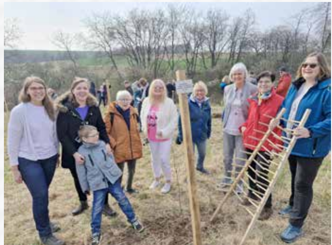
Der Verbisschutz muss noch drum herum.