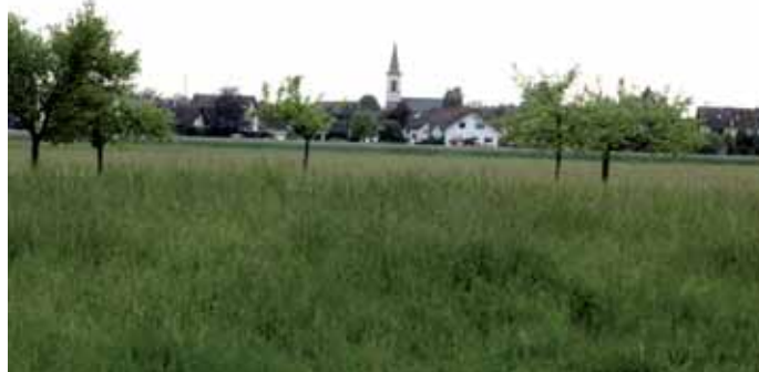
Auf einer etwa sieben Hektar großen Fläche am östlichen Ortsrand könnte ein Neubaugebiet wachsen. Doch schon jetzt gibt es Bedenken wegen des Verkehrs und des Flächenverbrauchs.

Mit für Eppertshäuser Verhältnisse knapper Mehrheit legten sich die Gemeindevertreter auf den Kita-Standort an der Babenhäuser Straße fest und beschlossen, das Forstgelände zu kaufen.