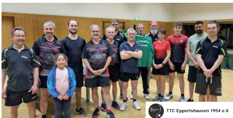
TTC Eppertshausen 1954 e.V.

Vereinsnachrichten und Anzeigen unter eppertshausen@druckerei-reichert.de